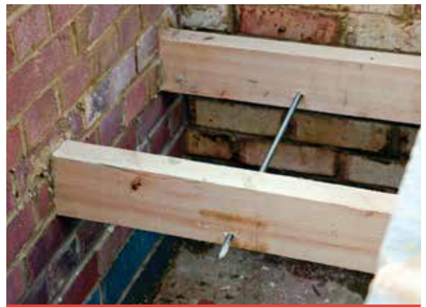
BowTie HD's geïnstalleerd door parallelle vloerbalken