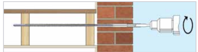
2. Zet het BowTie HD hulpstuk in een roterende SDS-hamerboor, bevestig de BowTie HD en drijf deze (slagsysteem uitgeschakeld) in en door de eerste en tweede balk.