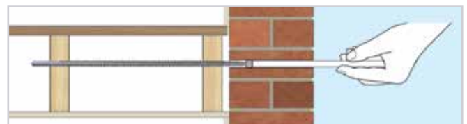
3. Breng de kunststof huls aan over de BowTie HD en gebruik het hulpstuk om hem naar de achterkant van het gat in de muur te duwen (buitenblad van de spouwmuur).