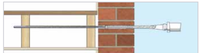
4. Spuit PolyPlus hars in het gat om te vullen, bevestig de BowTie HD aan het metselwerk, laat het hars stollen en herstel het oppervlak.